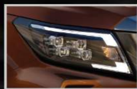
Đèn pha hệ đa bóng Quad-LED Projector

Không đơn thuần chỉ là một phương tiện để di chuyển, Nissan Navara mang đến cho bạn cảm hứng muốn được trải nghiệm ngay từ cái nhìn đầu tiên.