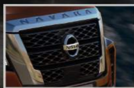
Lưới tản nhiệt cỡ lớn mạ chrome tạo vẻ sang trọng