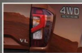
Đèn hậu LED tạo hình chữ C, giúp cho chiếc xe luôn nổi bật khi đi trong đêm