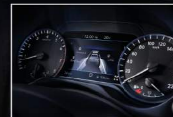
Màn hình hỗ trợ lái tiên tiến*

Màn hình hỗ trợ lái tiên tiến kích thước 7" của Nissan Navara hiển thị các thông tin quan trọng, giúp bạn tự tin cầm lái.