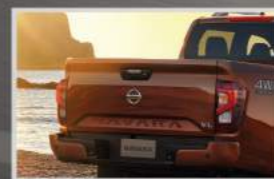
Chiều cao thùng sau tăng, cải thiện khả năng chở hàng