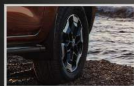
Mâm xe hợp kim 18" tạo hình 6 chấu khỏe khoắn