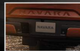
Cản sau thiết kế mới tạo sự thuận tiện khi lên/xuống